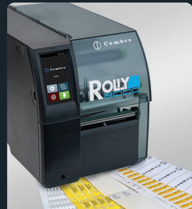
ROLLY3000 - Drucker