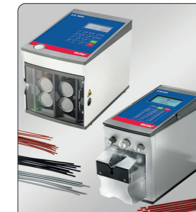
Abisolieren / Ablängen