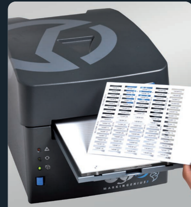
MG3 - Drucker

Abgesehen von der Vielzahl an direkten Schalttafelkomponenten liefert die Otto Schoch AG verschiedene Lösungen zur Markierung und industriellen Kennzeichnung von Bedienfeldern, Klemmen, modularen Bauteilen und Schaltschränken. Die Thermotransferdrucker ermöglichen die rasche Markierung von Kabeln und anderen kennzeichnungspflichtigen Elementen. Besonders reichhaltig ist das Angebot für den Bereich Steuerungs- und Schalttafelbau. Somit sind wir in der Lage die unterschiedlichen Ansprüche der einzelnen Anwendungsbereiche gleichermassen zufrieden zu stellen.